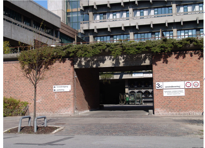
Indgang fra Blegdamsvej til Panum Institutttets Varegård